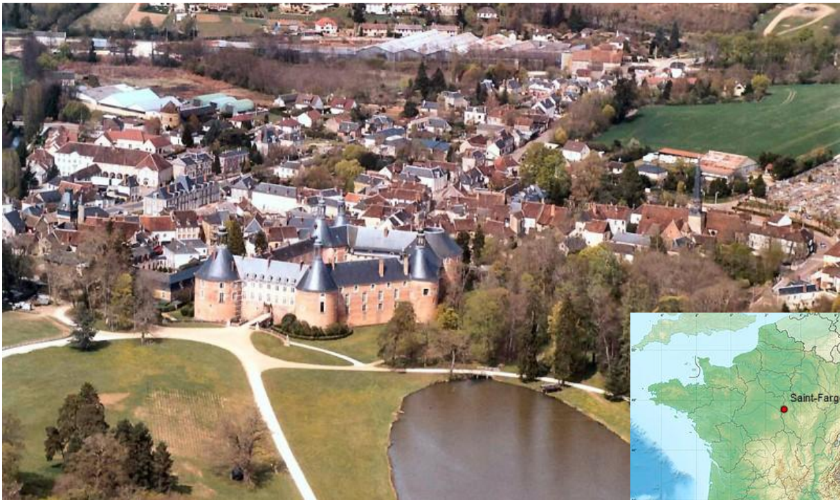
Vue Générale de St Fargeau