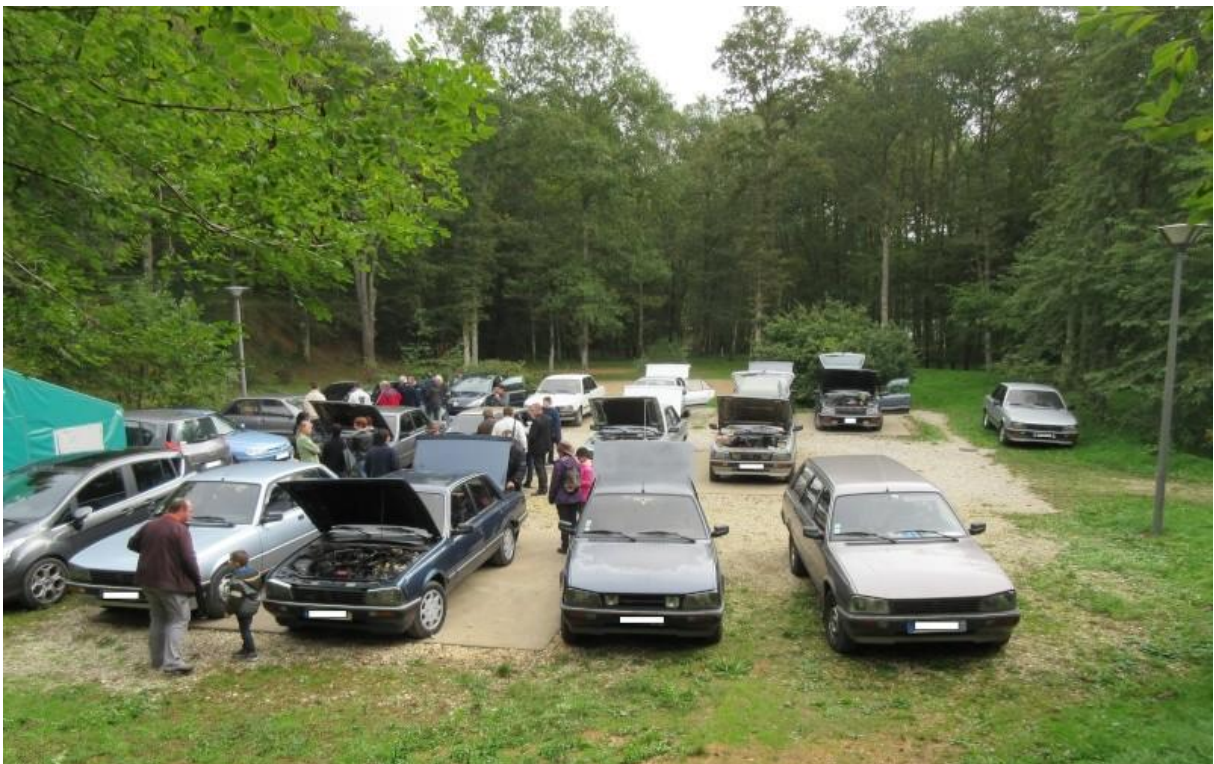
Les PEUGEOT 505 présentes lors de ce weekend (photo prise pendant le vide-coffre le dimanche matin après la réunion d'AG)